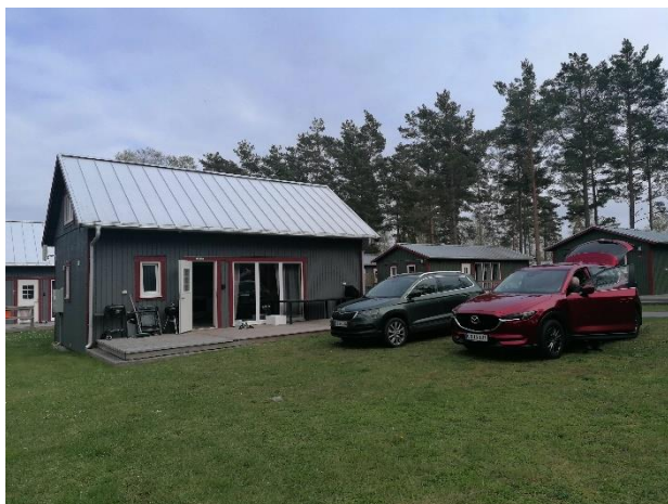
Vi mødtes i løbet af fredagen ved vores hytte på Löttorp Camping

Ture gik igen i år til Øland Sverige. Vi var 6 gæve lystfiskere der ville give Øland endnu et forsøg.