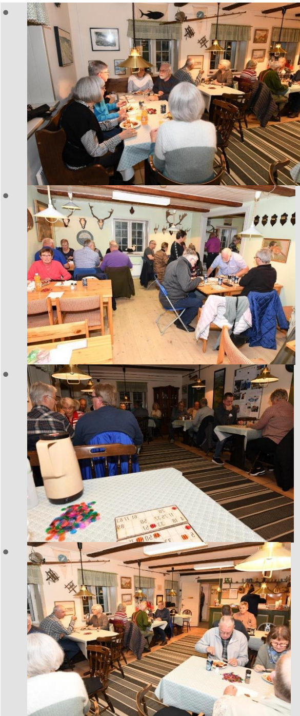
• Stemningsbilleder fra Bikis og Banko d. 19 oktober i Revhuset (PN)